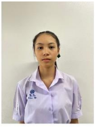
ทรงผม นักเรียนหญิง เปียเก็บข้างรวบมัด