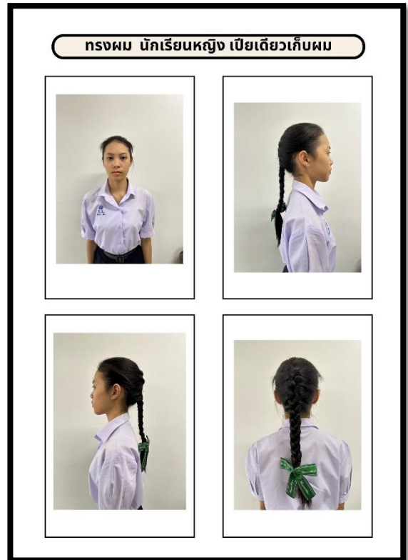
ทรงผมนักเรียนโรงเรียนธัญรัตน์แบบถ่ายประกาศ